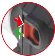
Quick lock ports